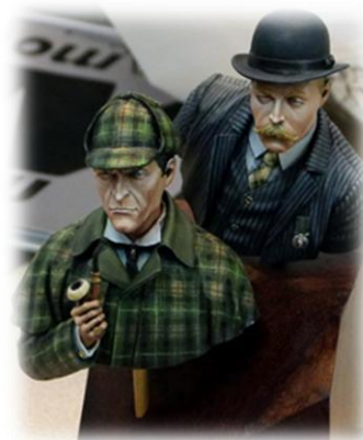
Réalisation Jean-Louis Balanec