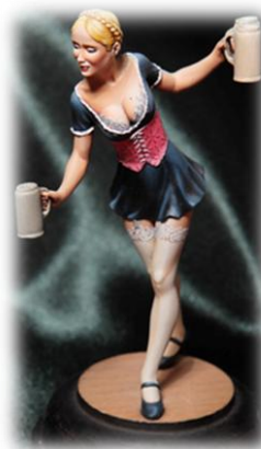
Réalisation Jean-Louis Balanec

Il est impératif de déplacer son véhicule ensuite sur les parkings tout proches pour des raisons d'accès et de sécurité.