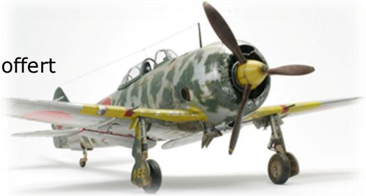
Réalisation Ludovic Molandre

18h00 : Fermeture et démontage des stands