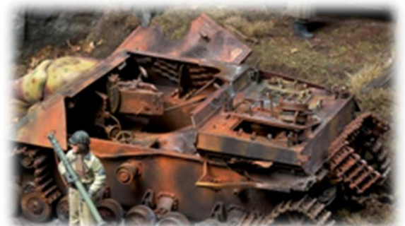
Réalisation Frédéric Astier