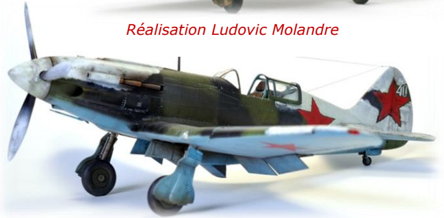
Réalisation Ludovic Molandre