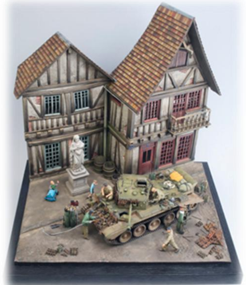
Réalisation Frédéric Astier